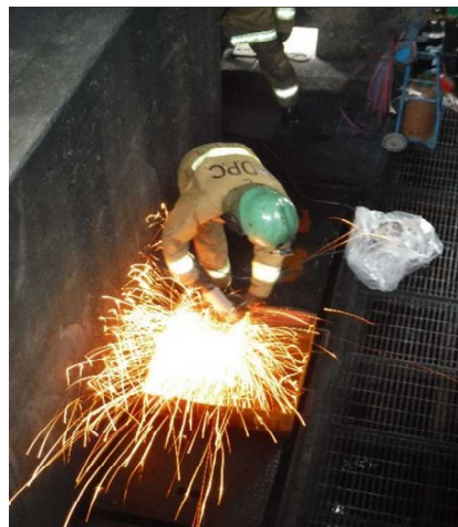
グラインダーの火花による火災の再現